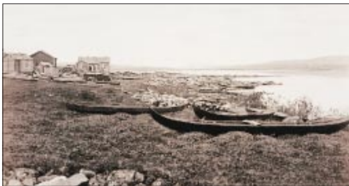
Pitkä jokivene oli vuosisatoja rovaniemeläisten tärkein su-lan ajan kulkuväline. Ounas-jokisuun rantaa 1800-luvun lopussa.

mutta Rovaniemellä luetteloi-hin kelpasivat vain talonpojat. Myös saamelaisten tiedetään ryhtyneen toisinaan talollisiksi. 1600-luvun lopulla Rova-niemen verotiloista jopa kym-menesosan on arvioitu olleen saamelaisväestön hallussa. Pääosa saamelaisista kuitenkin väistyi kauemmaksi suomalai-