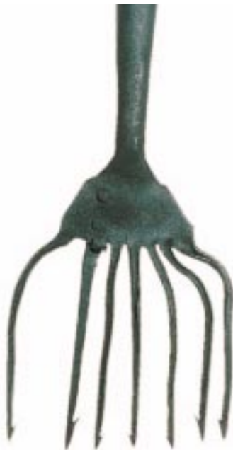
Maasepän tekemää 7-piikkistä atrainta käytettiin tuohustamiseen. Rovaniemen kotiseutumuseo.

ta 1600-luvun vuosien lohisaaliista, noin 350 000 kilosta, rovaniemeläisten osuudeksi on arvioitu kymmenesosa. Pääosa meni verojen maksuun ja myyntiin, ja itse tyydyttiin syömään vähempiarvoisia lohien osia ja muita kaloja. 1650-luvulta vuoteen 1688 alajuoksun ja yläjuoksun talolliset kävivät keskenään katkeraa kiistaa patopyynnin oikeuksista aina kuningasta myöten. Vanhat rovaniemeläistilat säilyttivät oikeutensa osallistua karsinapatopyyntiin myös alempana jokivarrella. Erityisesti 1700-luvulla lohienkalastusoikeuksia vuokrattiin yleisesti oululaisille kauppiaille velkojen maksamiseksi.