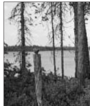
Kalapatsas veistettiin jumalaksi sinne, mistä saatiin hyviä saaliita, tässä Syvälammin rantaan Rovaniemen koil-lisosissa. Muurolan lohivadon luona tällaista seitaa palvottiin vielä 1800-luvun alussa antamalla sille ruokaa ja tupakkaa.

Rovaniemeläisten ja saame-laisten suhteet olivat ainakin 1600-luvulla niin hyvät, että käräjille ei heidän välisiään juttuja tullut. Seka-avioliitot häivyttivät vähitellen rotu- ja kielierot, mutta pitkälle 1700-lukua useat järvisedut olivat saamelaisten asuttamia. Hei-dän viimeksi käyttämiään asuinpaikkoja ovat mm. Kam-sajoen suu, Kemijokivarsi Muurolan ja Korkalon välillä, Suopajärven seutu Nammassa, Olkkajärven Kenttäniemi, Kuoksajoen seutu ja Airiselkä.